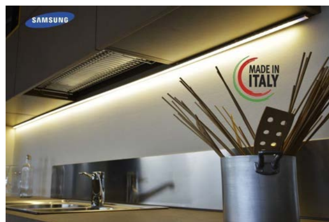
Esempi d'illuminazione getibile con comando a distanza