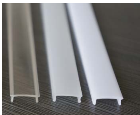
Dettaglio diffusore nelle 3 versioni trasparente, satinato e opalino